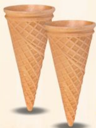
Stożek Marco karton 575 szt.