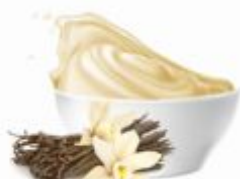
PERNIGOTTI28 | Vaniglia Pura Pasta czysta wanilia, op.3kg/6kg