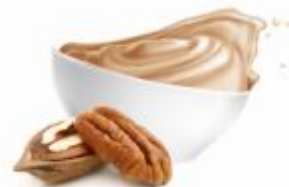
SEMPRE139 | Pasta z orzechów pekan 100% op.3kg