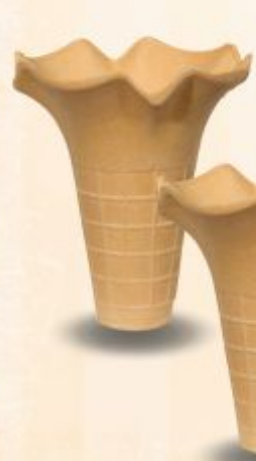
Kubek Irys karton 180 szt.