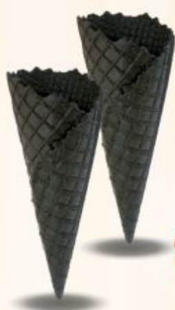
Rożek Borneo Oleo karton 228 szt.