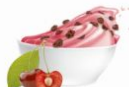
PERNIGOTTI169 | Variegato Amarena Top Pasta do przetożenia wiśniowa, 40% wiśnie, całe owoce i półowki