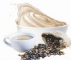
PERNIGOTTI161 | Variegato Latte Pasta do przetożenia op.5,5kg