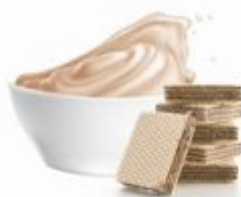
PERNIGOTTI143 | Variegato Amor Pasta do przetożenia o smaku wafelka z nadzieniem czekoladowym z orzechami, op.4kg w kartonie