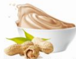
PERNIGOTTI184 | Nocciola Scura latfa pekan Pasta orzech laskowy ciemny, op.2,8 x 2