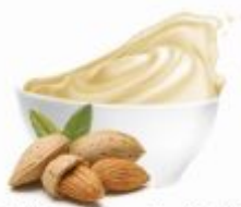
PERNIGOTTI152 | Mandorla Elite Pasta migdałowa op.2,4kg/4,8kg