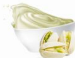
SEMPRE145 | Pasta z orzechów pistacji 100% op.3kg