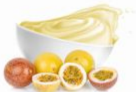
SEMPRE156 | Variegato Marakuja Pasta op.3kg/6kg